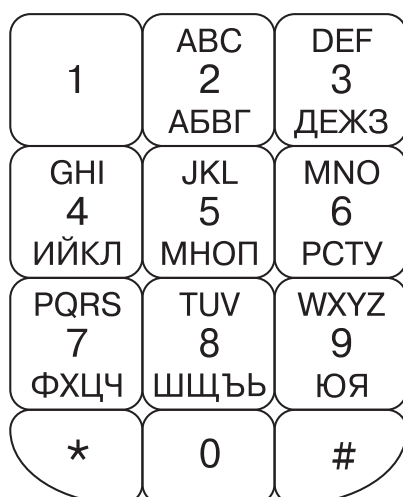
Фигура 3 Схема за подреждане – “Азбучна”

Схемите на двете системи клавиатурни подредби – “Азбучна” и “Фонетична” са показани съответно на Фигура 3 и Фигура 4 с разположение само на клавишите с номера от 2 до 9, а самите системи са описани в Таблица 3 и Таблица 4, където са посочени номера на клавиша, позицията му, изписаните букви на латиница и разположените на тяхно място букви на българската азбука, както и кодовите номера в шестнадесетично представяне на буквите от българската азбука според Unicode.