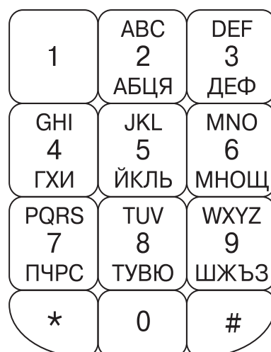
Фигура 4 Схема за подреждане – “Фонетична”